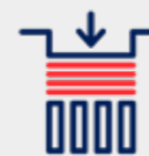
Séparation des poses

Jusqu'à quatre groupes de finition personnalisés complétés par le séparateur AutoBlank entièrement automatique et intégrable assurent une flexibilité de production maximale – avec un confort de conduite maximal et une qualité sans compromis.